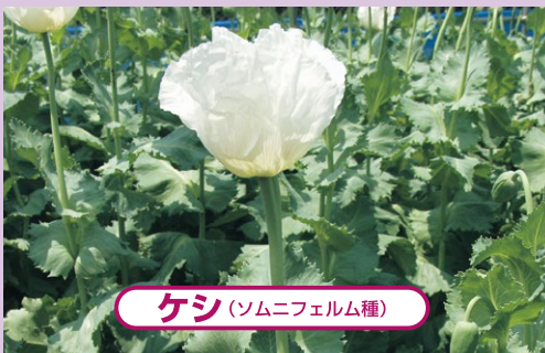
ケシ (ソムニフェルム種)