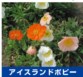
アイスランドポピー