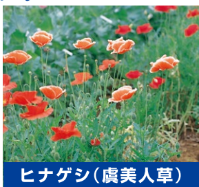
ヒナゲシ(虞美人草)